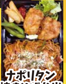
ナポリタン 焼きそば弁当