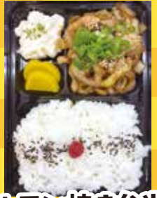
ホルモン焼き弁当